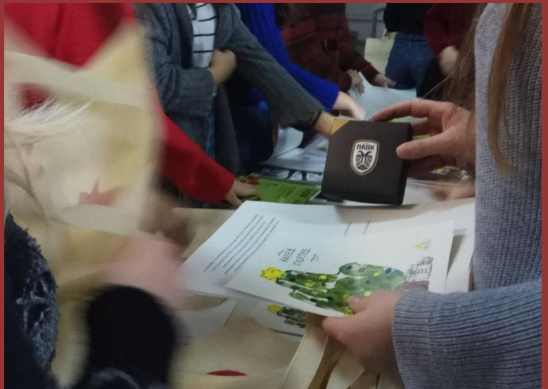
Photo Credit: Ιωάννης Σεμερτζίδης, Βραβείο Διαγωνισμού Φωτογραφίας Εθελοντών #rodifestival2018

«Μέσα από το Φεστιβάλ ήρθα σε επαφή με έναν κόσμο που λίγοι έχουν την ευκαιρία να γνωρίσουν, όχι γιατί δεν έχουν τις ευκαιρίες αλλά γιατί τον προσεγγίζουν επιφανειακά. Η στιγμή που το συνειδητοποίησα αυτό ήταν την ημέρα που ήταν οι χορευτικές εκδηλώσεις. Απλό πράγμα ο χορός, αν κοιτάξεις προσεκτικά βλέπεις όλα τα συναισθήματα, όλο τον κόσμο, όλη την ψυχή αυτού που χορεύει. Αν κοιτάξεις θα δεις ότι λέει την ιστορία του. Το πρωί λοιπόν Όταν κοιτούσα την ομάδα με τα παιδιά με σύνδρομο Down ένιωσα ότι ερωτεύομαι αυτόν τον κόσμο που μου έδειχναν μέσα από τον δικό τους ξεχωριστό τρόπο να χορεύουν, κάθε μία κοπέλα ξεχωριστά έδειχνε ότι είναι διαφορετική και όμορφη, ξεχωριστή με πράγματα να προσφέρει στον κόσμο». Μπιάνκα-Αντωνία Κατσιφλά